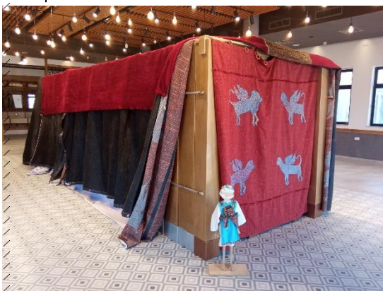
ב' אדר א תשפ"ב